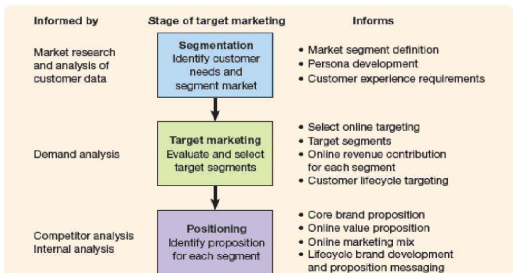
Gambar 3. Tahapan dalam pengembangan strategi target pemasaran (Chaffey:2011:408)

Menurut Chaffey(2011:439), komponen perencanaan E-Marketing merujuk pada aktivitas yang dilakukan oleh manajer untuk menjalankan sebuah rencana. Pertanyaan yang harus diselesaikan ketika menjalankan sebuah aksi adalah sebagai berikut :